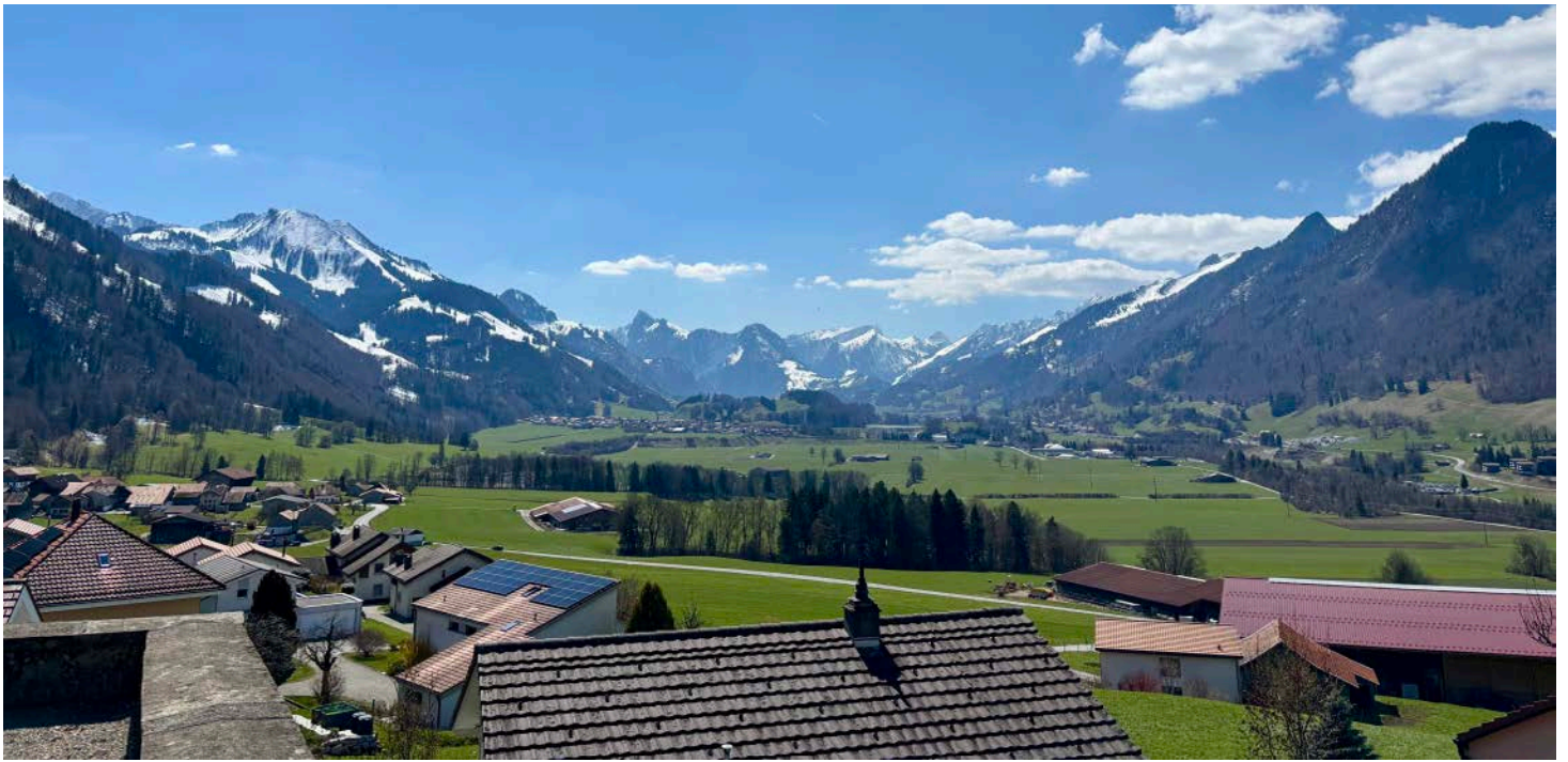
Paysage suisse typique.

meilleurs du pays en termes de conformation. La stagiaire a donc eu l'occasion d'accompagner son maître à l'exposition nationale; on y accueillait pendant quatre jours 650 vaches en provenance de 153 élevages de race Holstein, Holstein rouge, Suisse Fleckvieh. Vous vous doutez bien que la stagiaire a collaboré à la préparation des animaux pour la présentation : elle considère que cela lui a permis d'approfondir ses connaissances. En plus, elle a pu accompagner un groupe de fermiers français de passage et visiter quelques autres fermes en leur compagnie.