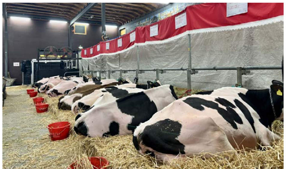
Silence! Troupeau au repos.

s'est même rendue à Zermatt – 3 900 m d'altitude pour deux journées de ski. À prime abord, elle a apprécié de voir du pays tout en travaillant; puis, un brin songeuse, elle murmure : « Ferme Lebel compte aussi sur moi pour poursuivre l'amélioration du troupeau... et ça aussi j'aime bien y penser : c'est mon défi!.... »