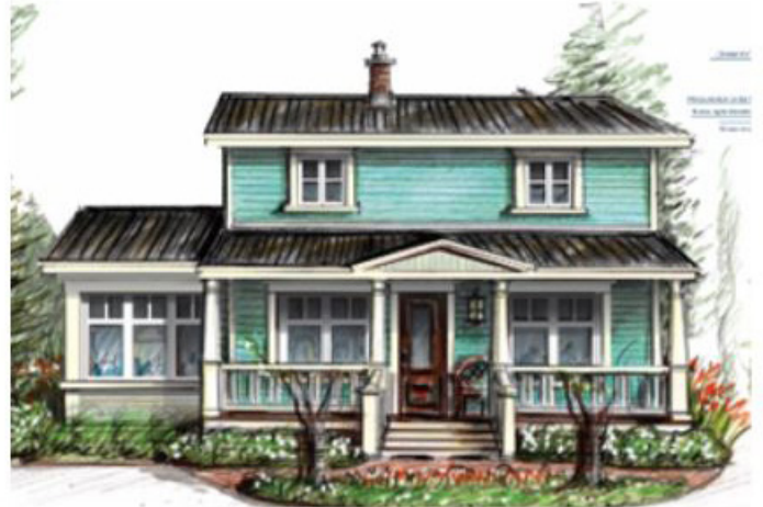
Après : nouvelle galerie et agrandissement