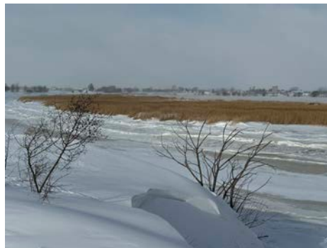
Petite colonie de phragmites au début ouest du Chemin du Sud-de-la-Rivière.

pousser à travers ces nouvelles colonies et de ce fait, nous perdons toute la biodiversité naturelle de ces milieux, faune et flore. L'action du groupe de citoyens de Rivière-Ouelle a pour but de justement préserver la biodiversité de l'Anse-des-Mercier tout en maintenant la vue sur le fleuve et sur les activités récréatives qui se déroulent sur la grève.